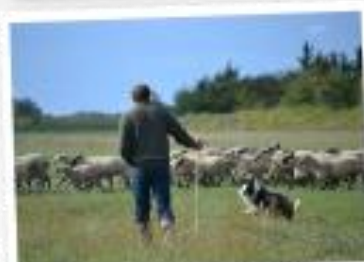
Les moutons de prés-salés