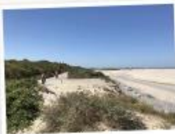
La Route Blanche