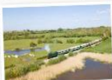
Le Chemin de Fer de la Baie de Somme